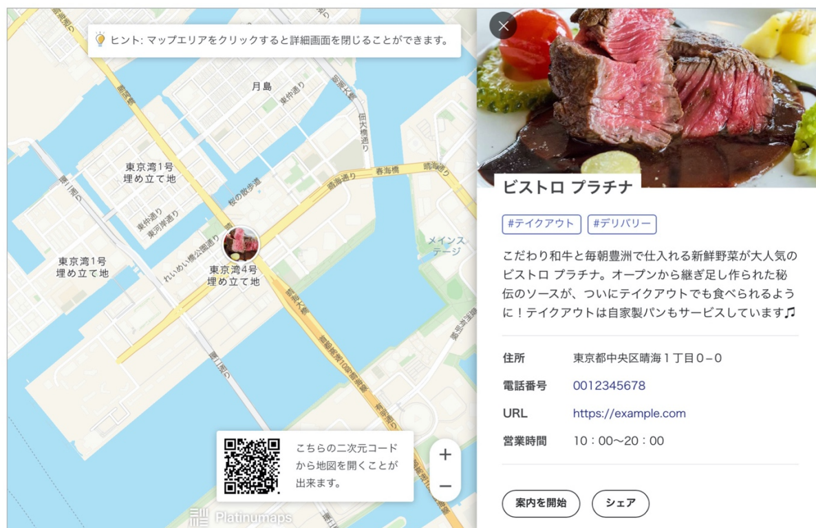
店舗詳細をマップ上で表示 店舗の説明や必要情報もしっかり記載

「プラチナマップ」はオリジナルのテイクアウトマップを簡単に作成し、完成したマップを WEB サイトに貼付けたり、SNS でシェアできます。マップは現在地表示や検索、食べ物のジャンルごとのカテゴリー分けも可能です。テイクアウト対応店を可視化させ、近隣のお店を見つけやすくしたテイクアウトマップは、対応店の認知を拡大させ、実際の来店とテイクアウトを促進させられるはずです。